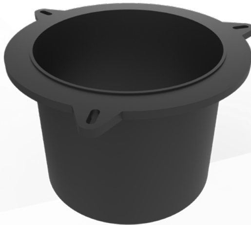
01 FillPro Schürze FillPro-skirt