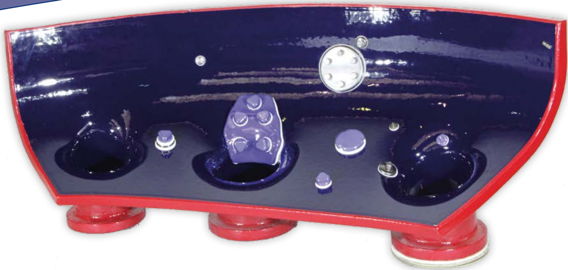
1: THALETEC-Exponat mit verschiedenen Reparatursystemen / THALETEC exhibit with various repair systems