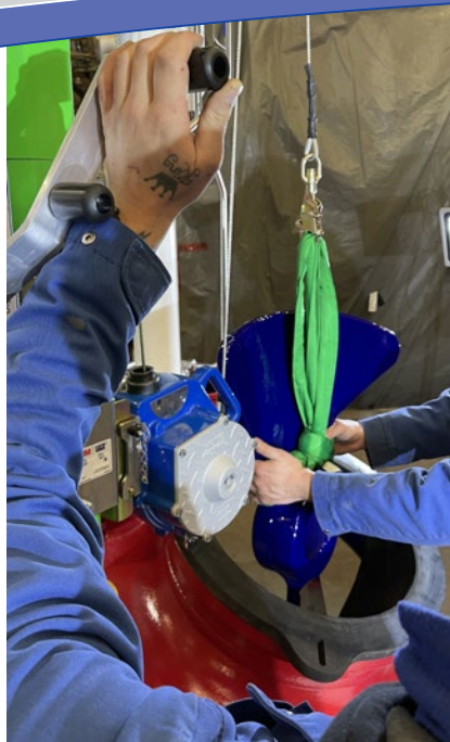
⌚ 02 Davit Hebesystem, genutzt als Hebezeug zum Einbringen eines emaillierten Rührorgans in einen Rührbehälter