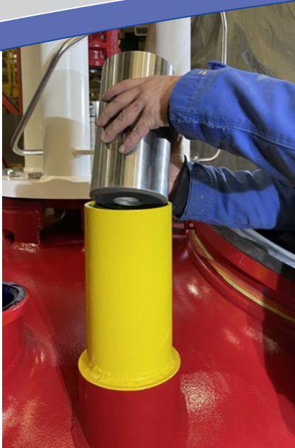
⌚ 01 THALETEC SafeBase Anschlagpunkt mit Einsteckhülse